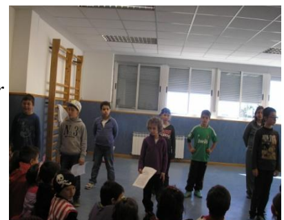
Alumnos del taller de teatro.