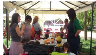
Momento para comer nuestros bocadillos.