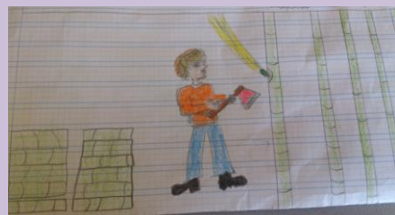
Cortador de bambú