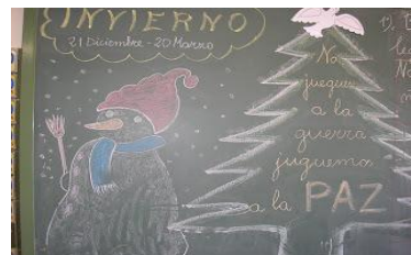
Alumnos del 1º Ciclo.