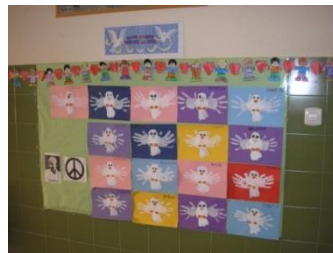
Mural de los alumnos de infantil.