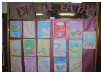
Mural de 2º Ciclo