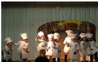
1º y 2º de Primaria