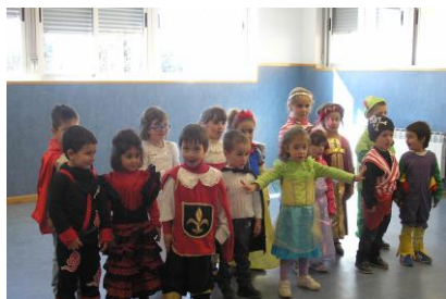
Así nos enseñaron la canción del carnaval nuestros alumnos de infantil.