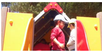
Alumnos de infantil disfrutando en los toboganes