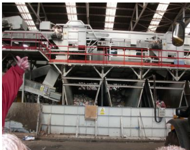
Depósitos de residuos