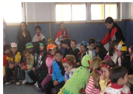
Cantando la canción del carnaval.